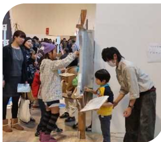
左官工事業:塗り壁作業